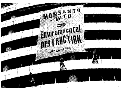
กรีนพีซแขวนป้ายประท้วง มอนซานโต ที่ทำให้เกิดการปนเปื้อนพันธุกรรม