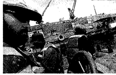
กรีนพีซเผชิญหน้ากับขบวนการลักลอบตัดไม้ในอินโดนีเซีย

เรียบเรียงจากนิตยสาร a day: TEAM ฉบับพิเศษ พ.ศ. 2546 และเว็บไซต์ของ กรีนพีซ เอเชียตะวันออกเฉียงใต้ www.greenpeacesoutheastasia.org/th/seaisssue02.html