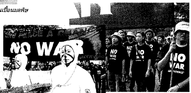
กรีนพีซประณามการทำสงครามในอิรัก